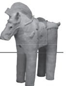
▲馬形埴輪(群馬県石山南古墳)