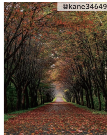
岩木山 オオヤマザクラ ネックレスロード