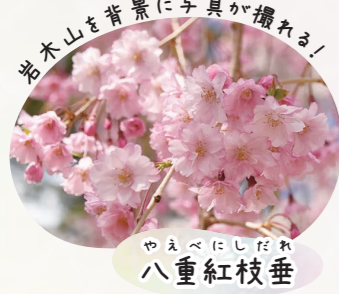
やえべにしだれ 八重紅枝垂