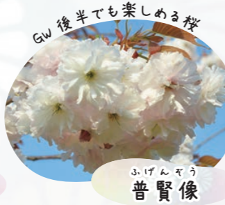
ふげんざう 普賢像

弘前公園内には染井吉野に続いて咲き始める桜(40品種約700本)があり、その桜の中から厳選した7品種の八重桜を『弘前七桜』と名付けています。