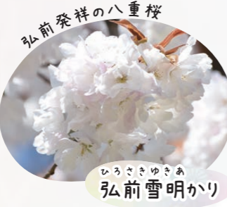
ひろさきゆきあ 弘前雪明かり