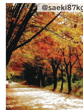
@saeki87kg 岩木山オオヤマザクラ ネckレスロード