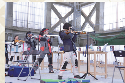
国スポリハーサル大会開催（5～9月）

脱炭素社会の実現に向けて、EV（電気）バス2台が土手町循環バスとして運行を開始しました。