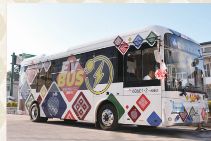
国・市補助で弘南バス株式会社がEVバスを導入（3月）

脱炭素社会の実現に向けて、EV（電気）バス2台が土手町循環バスとして運行を開始しました。