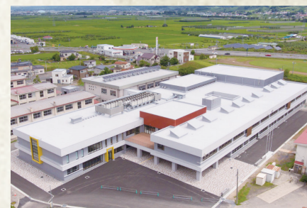
石川小・中学校等 複合施設全面供用開始（8月）

10月には多くの市民の皆さんにお集まりいただき、名誉市民顕彰記念式典・講演会を開催しました。