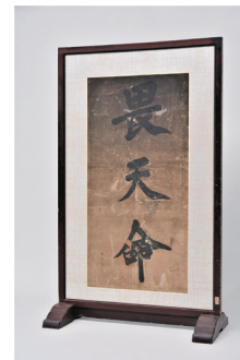
▲ 佐々木玄龍筆 衡立（市指定有形文化財、高照神社蔵・当館寄託）

問 高岡の森弘前藩歴史館（高岡字獅子沢、☎ 83-3110、1月19日(月)と2月16日(月)は休み）