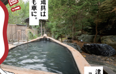
水軍の宿（鯉ヶ沢町）