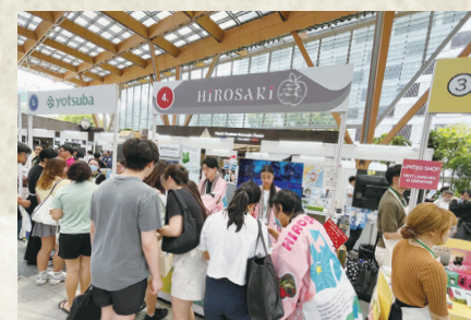
シンガポールにて 弘前プロモーションを実施（10月）

市内初の学校と、公共施設（地域交流館あじさい）が一体となった複合施設の全面供用を開始しました。