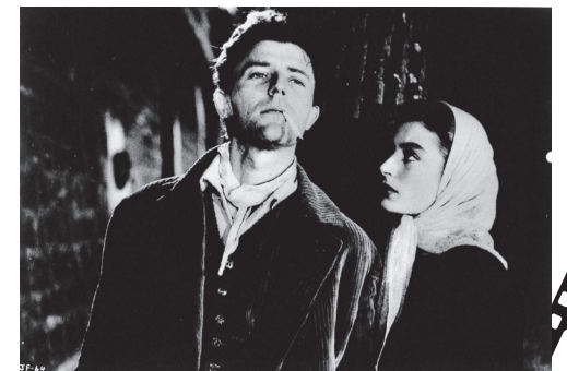
『モンパルナスの灯』© 1958 Gaumont-Astra Cinematografica-Continental Film GmBh