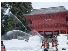
▲過去の訓練の様子