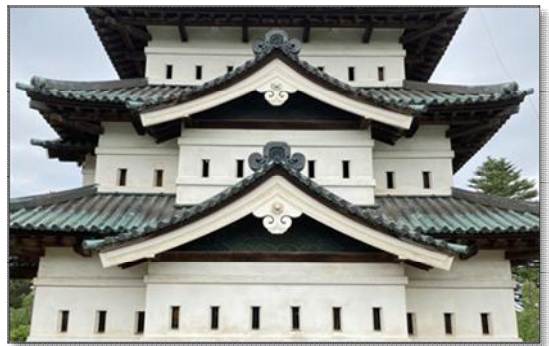
【写真6】天守の出窓と破風（東面）