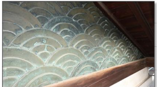
【写真7】天守出窓妻壁 青海波文銅板