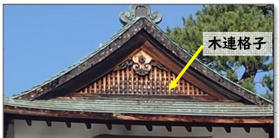
【写真8】二の丸辰巳櫓3階破風（東面）