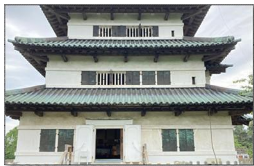
【写真2】弘前城天守の窓(西面)