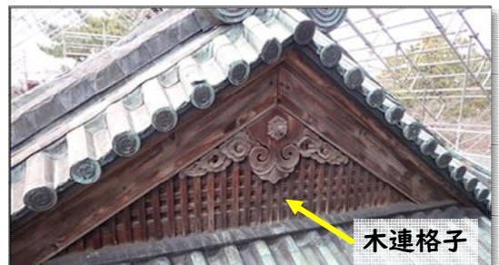
【写真9】二の丸東門2階破風（東面）