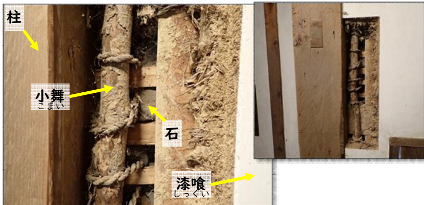
【写真4】弘前城天守内部1階の東面土壁（右上）と壁の構造（左下）