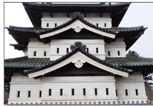
【写真3】弘前城天守の狭間(東面)