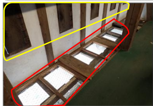
【写真1】弘前城天守の石落とし・狭間