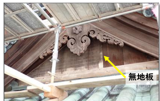
【写真10】北の郭北門2階破風（北面）