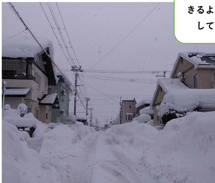
写真の例①：道路の状況（拡幅・排雪要望）