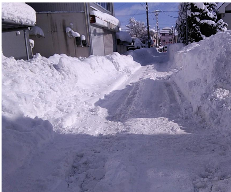
写真の例②：道路の状況（路面の状況が悪い）