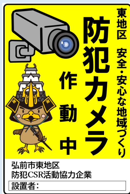
たか丸くんオリジナルデザイン

スマートフォンでQRコードをお読み取りください。 お申込後に、データ（パワーポイント及びPDF）を送付いたします。