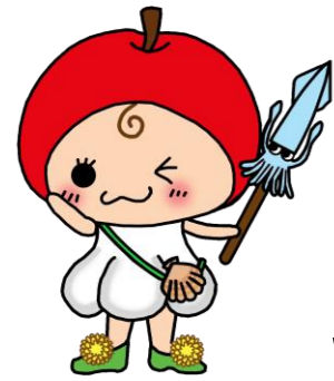
青森県学校栄養士協議会 食育推進キャラクター あぷにん