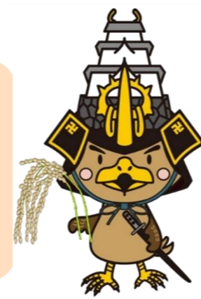
弘前市 マスコットキャラクター たか丸くん