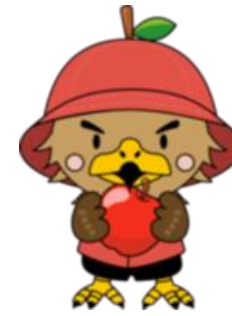
弘前市 マスコットキャラクター たか丸くん