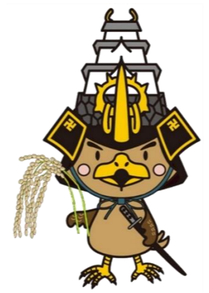
弘前市 マスコットキャラクター たか丸くん