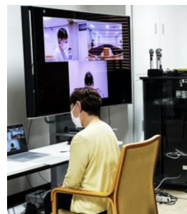
～実践コース～ 講師からのアドバイス