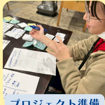
プロジェクト準備