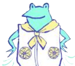
ファン付きウェア、 ネッククーラー