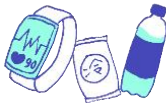
ウェアラブル端末、 応急セット