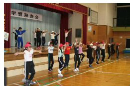
元気いっぱい4年生