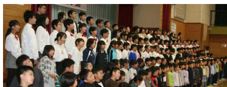
朝陽こどものうた 世界中のこどもたちが