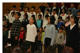
終わりのあいさつ