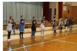
世界のはてまで行ってミヨ〜