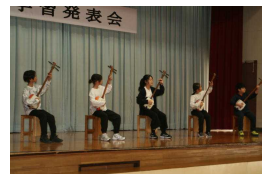
津軽じょんから節