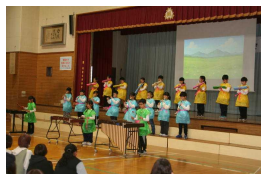
森の音楽パーティ