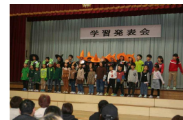
あらあらいたずらまほうつかい

10月25日(土)の学習発表会では、たくさんの人に見守られ、ちょっぴり緊張しながら、立派に発表できました。皆様、ありがとうございました。