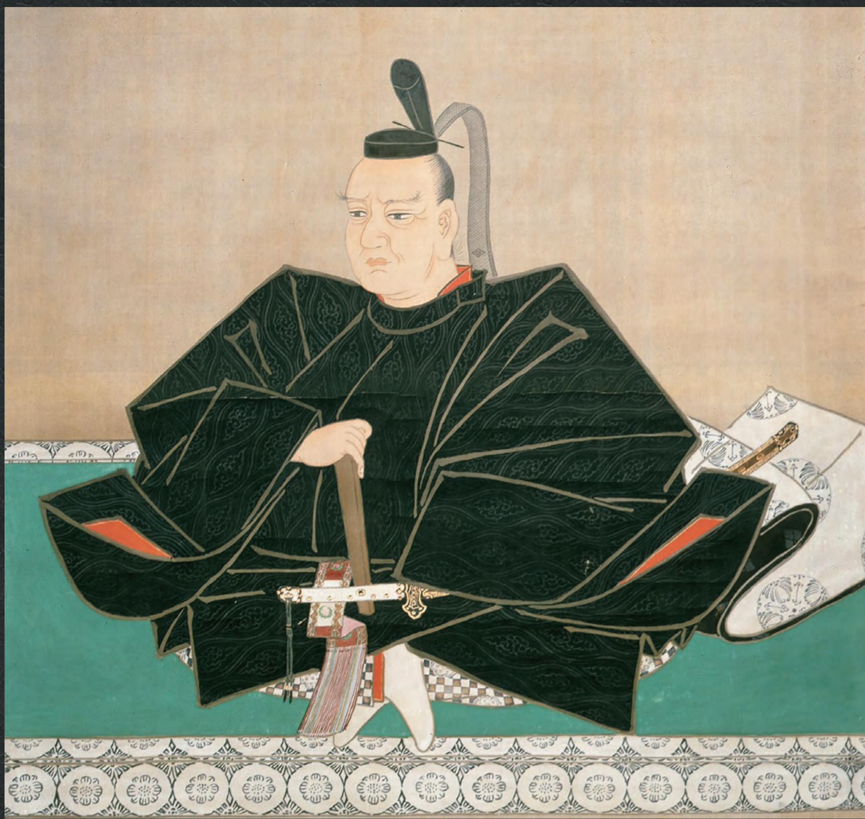
新井常償筆 津轻信政像(高照神社蔵)