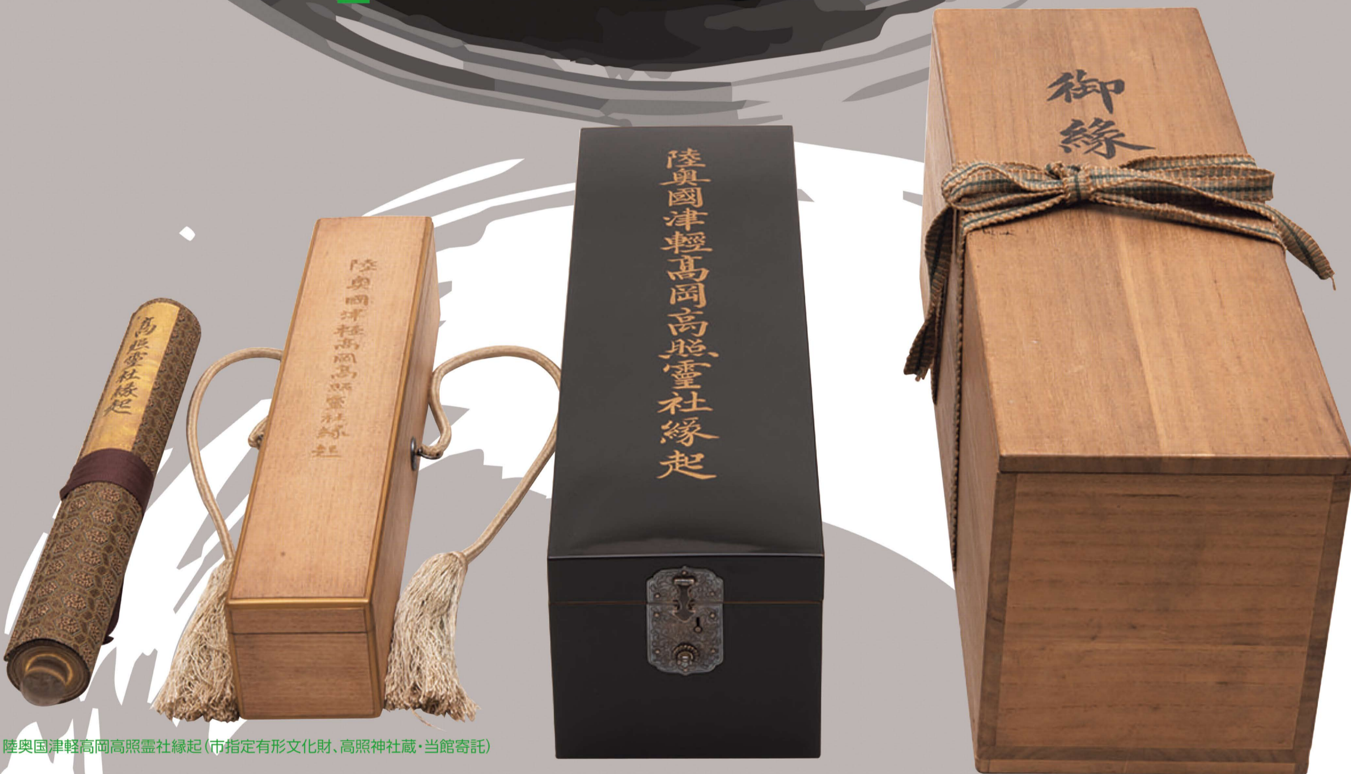
陸奥国津軽高岡高昭神社縁起(市指定有形文化財、高照神社蔵・当館寄託)