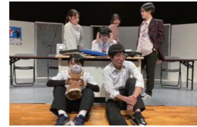
劇団ブランクスター

●劇団ブランクスター:プロフィール 弘前大学の演劇サークルです!「役者もスタッフもお客さんも楽しめる芝居」を目指し、「エンターテイメントとしての演劇」を創ることを目的として活動しています!