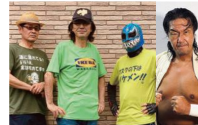
弘前笑会 with G